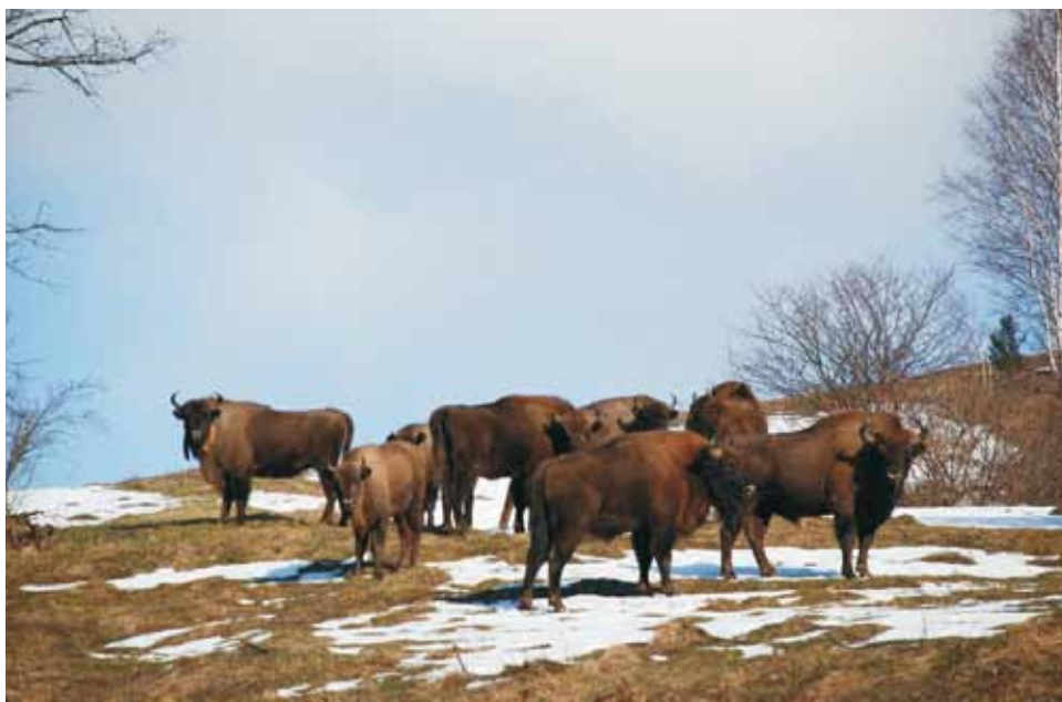
NÁRODNÝ PARK POLONINY