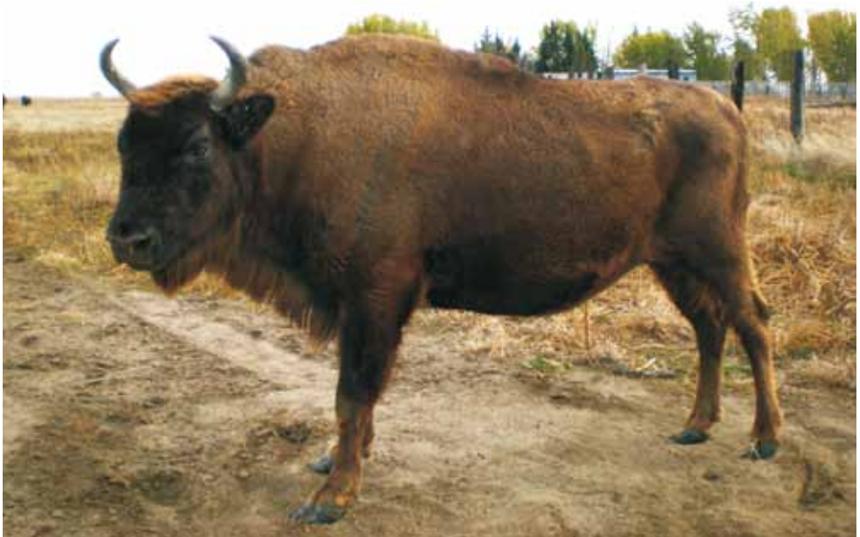
F 10520 CZNIKI

Avesta, 08.06.2009