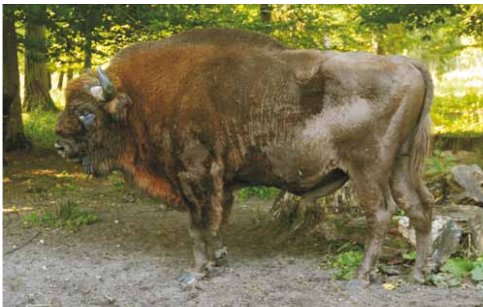
M 7751 PODRÓŻNIK