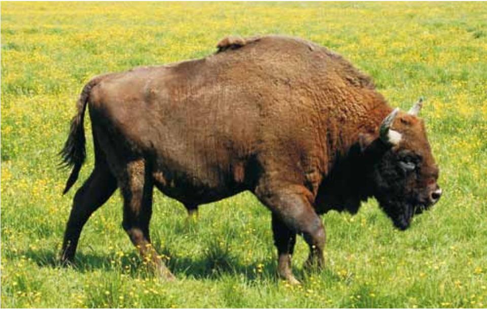
M 9127 AVPETER

Avesta, 08.06.2009