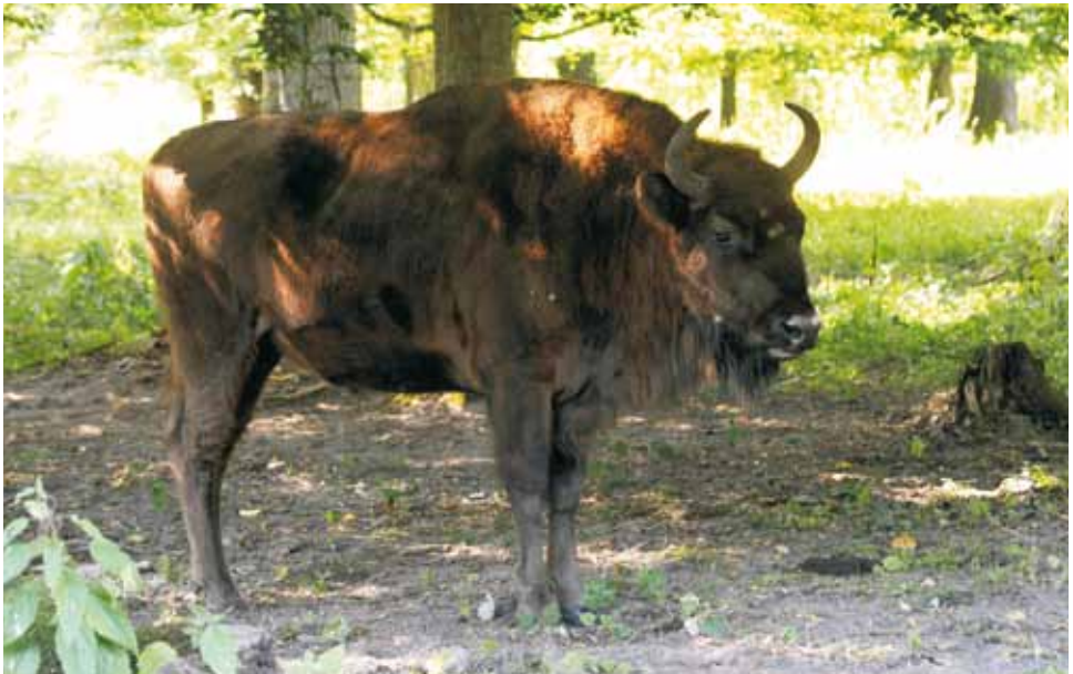
F 10363 POINTA