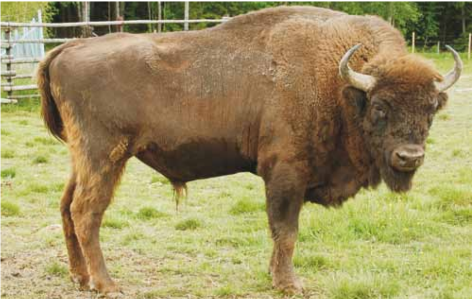
M 9913 ABURR

Avesta, 08.06.2009