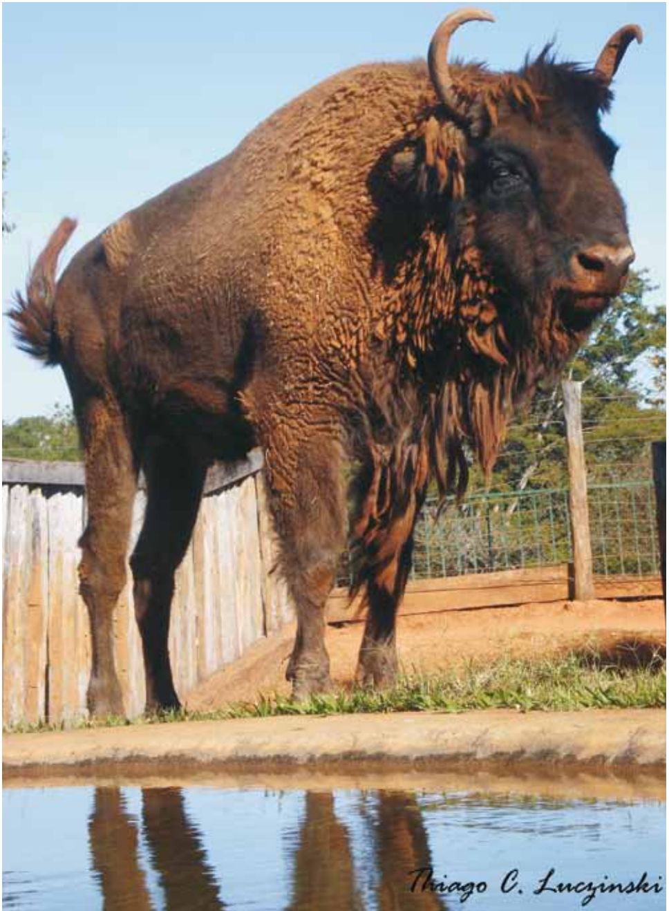
F 4524 ATANA 30-letnia żyjąca samica – 30 years old living female

Brasília, 2009