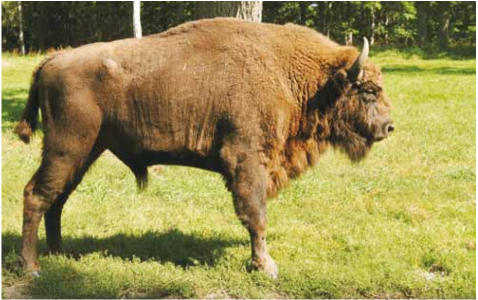
M 10771 POCZTYLION