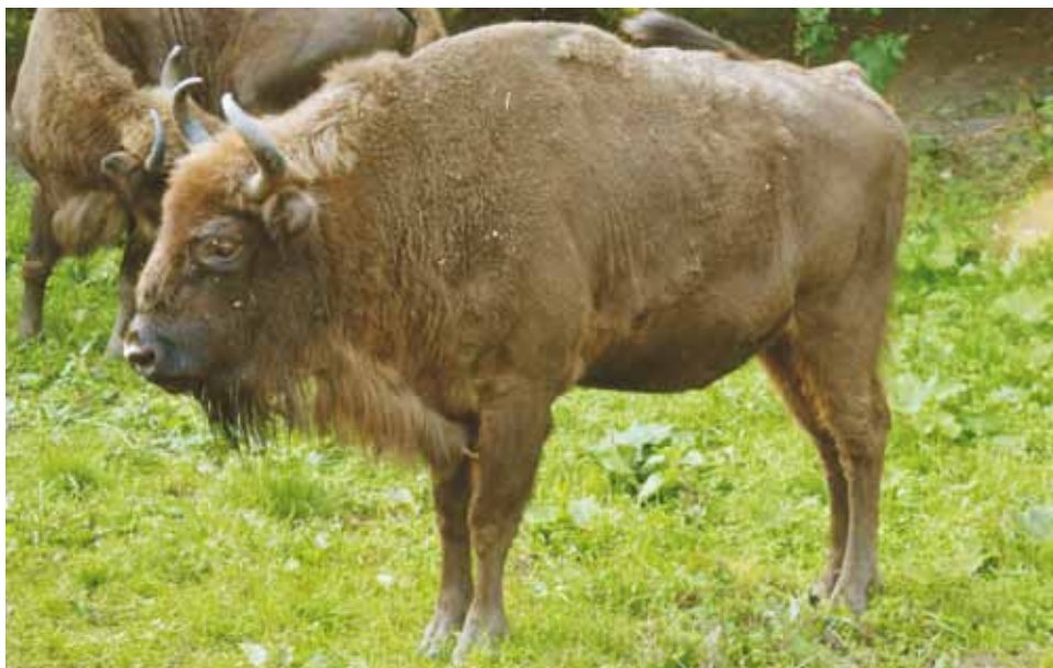
F 9172 PODLASIANKA II