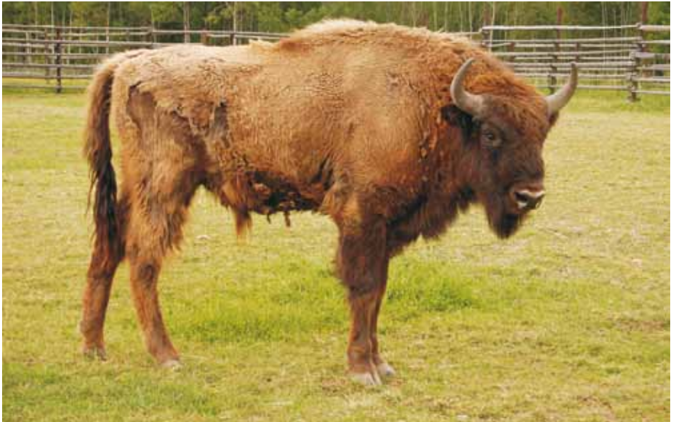
M 10937 BOTOW

Avesta, 08.06.2009