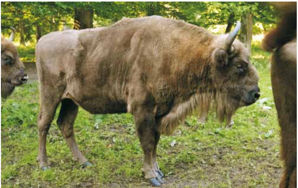
F 8944 POKRYWKA