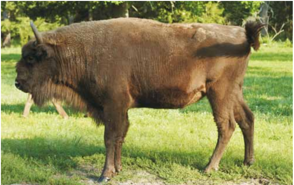
F 10360 PODESTA